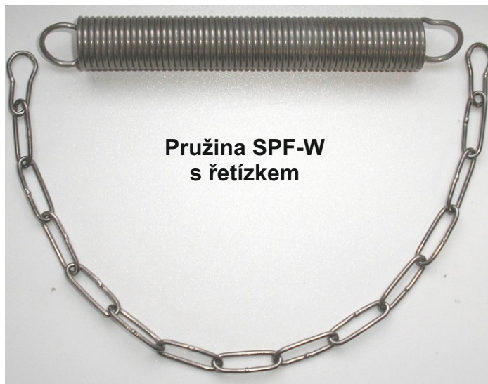
Pružina SPF-W s řetízem

Buben s lankem RL5 délka 500m Buben s lankem RL3 délka 500m