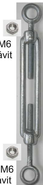
Matice M6 levý závit