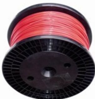
Lanko RL 3

Buben s lankem RL5 délka 500m Buben s lankem RL3 délka 500m